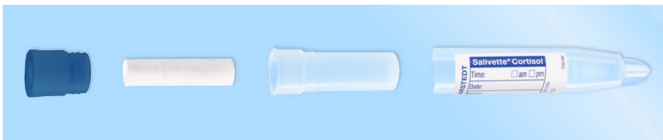
Afbeelding 1 : Salivette Cortisol

De Salivette (afb. 1) bestaat uit een buis, een inhangbuisje, een wattenrolletje en een stop.